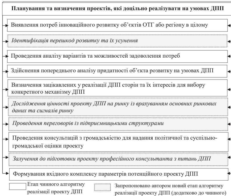
Рис. 3. Алгоритм проведення етапу планування та визначення проектів, які доцільно реалізувати на умовах ДПП