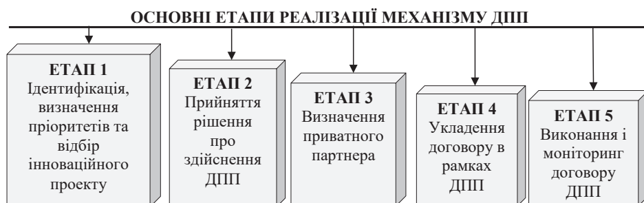
Рис. 1. Загальна схема реалізації механізму ДПП

Законодавство, що регулює ДПП сьогодні потребує оновлення та удосконалення, адже аналіз існуючої процедури реалізації проектів ДПП виявив її непрозорість та неефективність. Заплутаний та складний характер нормативно-правової бази свідчить про необхідність спростити та підвищити прозорість системи ДПП, розширити та уточнити зміст окремих етапів реалізації ДПП [2, с. 67].